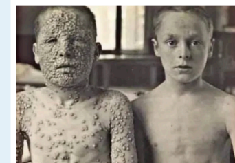
Två 13-åriga pojkar som utsatts för smittkoppor. Pojken till höger är vaccinerad, men inte pojken till vänster.

Ända in på 1900-talet var smittkoppor en fruktad sjukdom där tre av tio drabbade avled. Den 8 maj 1980 rapporterade Världshälsoorganisationen WHO officiellt att smittkoppor var utrotade, ett mål som hade uppnåtts tack vare omfattande vaccinering. Förhoppningen är att fler infektionssjukdomar ska gå att utrota. Närmast är sjukdomen polio som i dag endast finns kvar i två länder. Därefter står mässling, röda hund och kolera på tur.